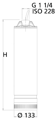
Abb. 1: Abmessungen Pumpenaggregat